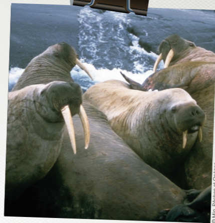
Morse de l'Atlantique

Au Canada, 345 espèces sont désignées en péril . Certaines sont plus en danger que d'autres.